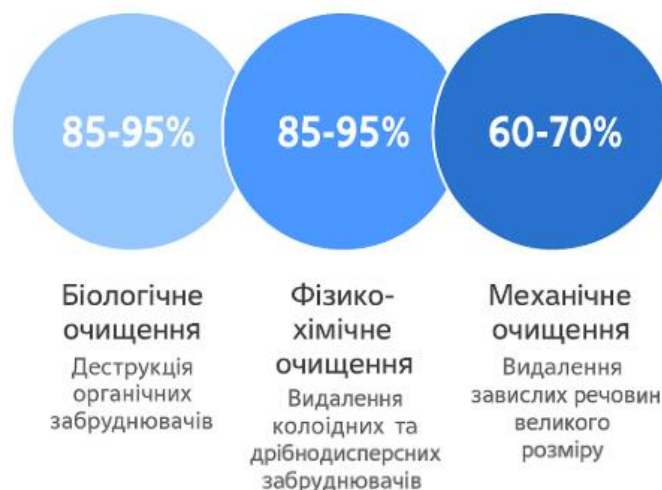
Рис. 2. Основні стадії очищення стічних вод целюлозно-паперових підприємств та їх ефективність

Традиційна схема очищення стічних вод целюлозно-паперових підприємств включає три основні стадії: механічне, фізико-хімічне та біологічне очищення (рис. 2).