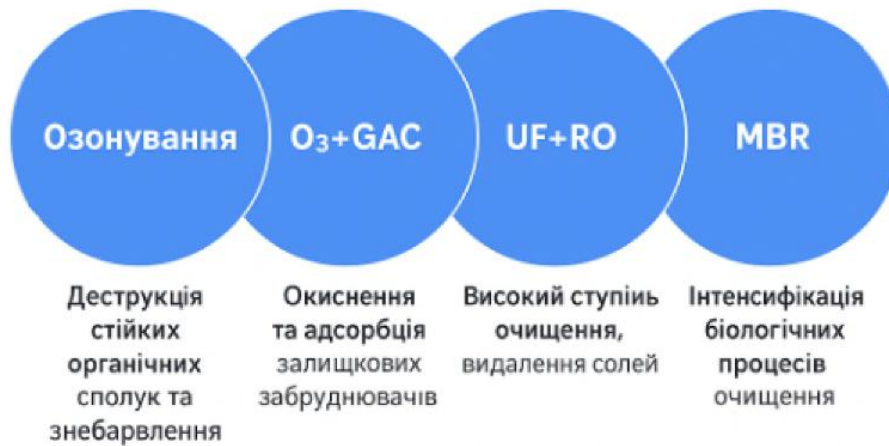
Рис. 3. Сучасні технології третинного очищення стічних вод ЦПП

Для досягнення високого ступеня очищення стічних вод ЦПП та відповідності жорстким екологічним вимогам необхідне застосування третинного (глибокого) очищення. (рис. 3).